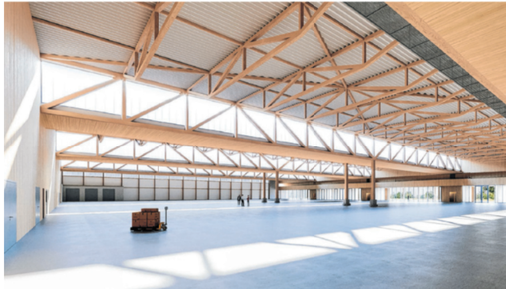
Rund 82 Meter lange Fachwerkträger mit nur einer Stütze überspannen die Halle. Baubuche ermöglicht es, die Spannweiten von bis zu 42 Metern zu überbrücken.

Das Waldenburger Unternehmen SWG-Produktion Schraubenwerk Gaisbach baut seit Oktober 2018 auf einer Fläche von 12 800 Quadratmetern eine Produktionshalle der besonderen Art.